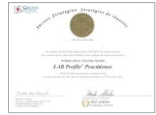
コース修了・課題合格者には認定証を発行します