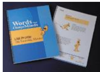
LAB プロファイル®公式テキスト